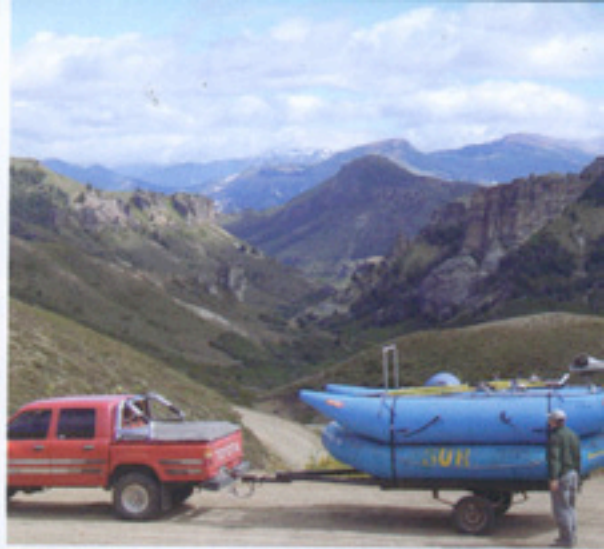
El río Caleufu, en la provincia de Neuquén, atrae la atención de avezados pescadores nacionales y extranjeros cada temporada.

Es durante ese instante tan esperado que el ataque de una trucha en la superficie a una mosca que estamos siguiendo con nuestra